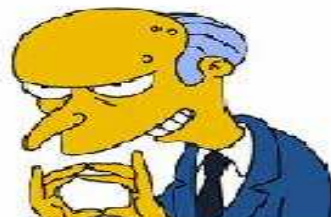
MR. BURNS Tal vez el que mejor retrata a la compañía