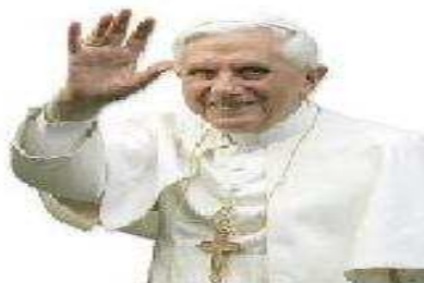
BENEDICTO XVI Más santo imposible