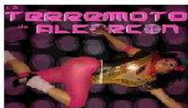
TERREMOTO DE ALCORCÓN Mujer, artista y de Alcorcón villa símbolo de trabajo y humildad