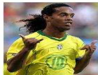
RONALDINHO Deportista y rico como Tiger, pero con este no engañas a nadie