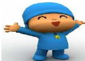
POCOYO Inocente y sin vicios